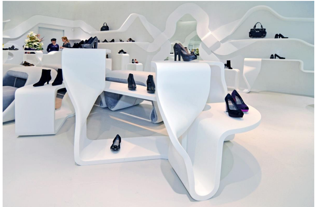
Acabado muebles: Madera posformable